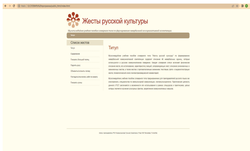
Рис. 1. Титульная страница мультимедийного учебного пособия словарного типа по обучению русским жестам (МУПСТ) /

В эпоху стремительного развития цифровых технологий существует множество конструкторов и программ для разработки электронных учебных пособий. Наше МУПСТ нашло свое техническое воплощение в программе Turbosite, работа в которой не требует наличия технических навыков и знаний языков программирования. По сути, это сайт, который отображается в браузере. Титульная страница МУПСТ на данном этапе работы представлена на рис. 1.